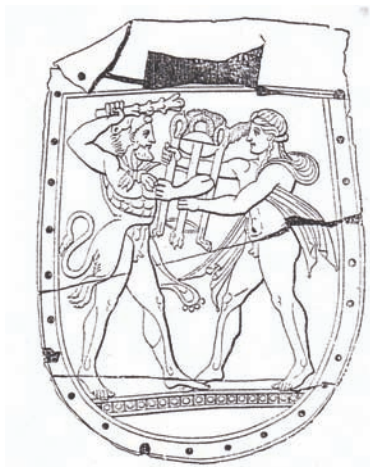
Сл. 2 – Металната плоча од Додона