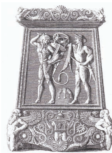
Сл. 3 – Канделабар од Дрезденската колекција