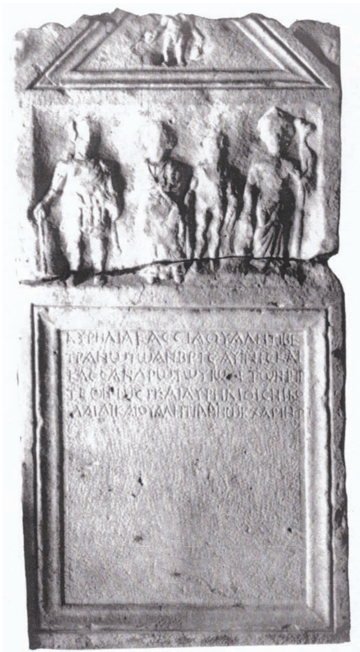
Сл. 6 – Сепулкрална стела од Небрегово