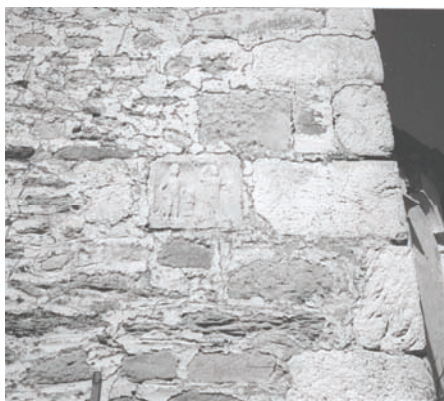
Сл. 5 – Стелата од Св. Никола – Небрегово