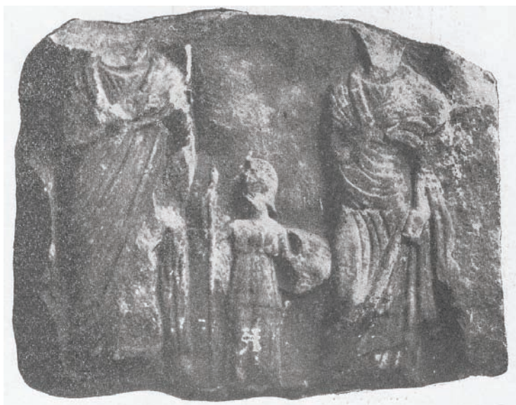
Сл. 7 – Стелата од Тројаци