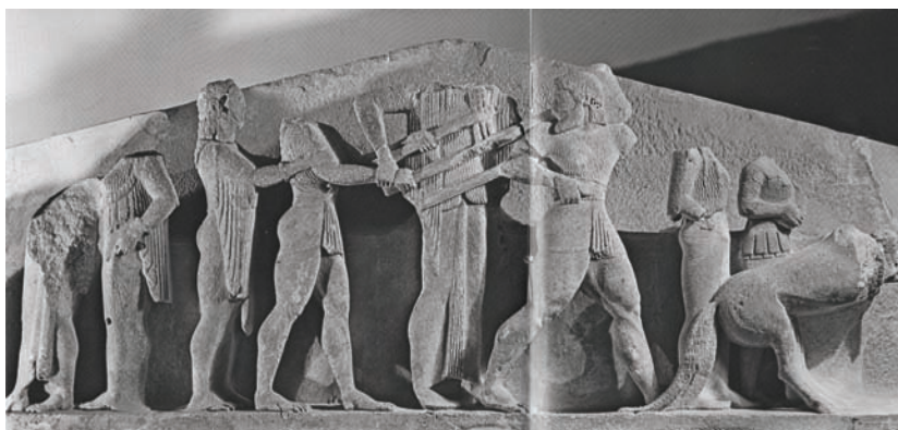
Сл. 4 – Релефот од Делфи