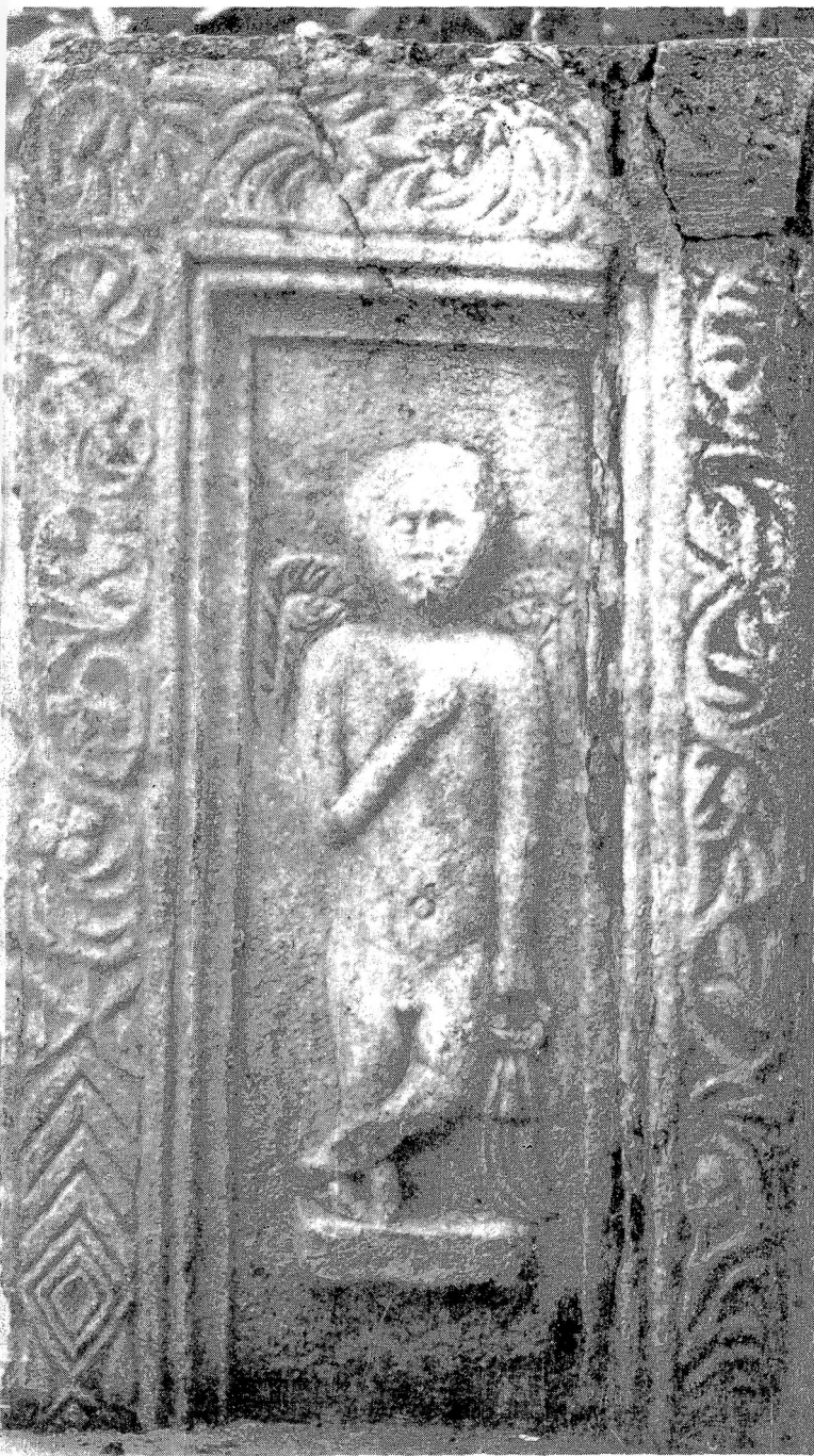
4. Надгробни ципус са представом генија на бочној страни