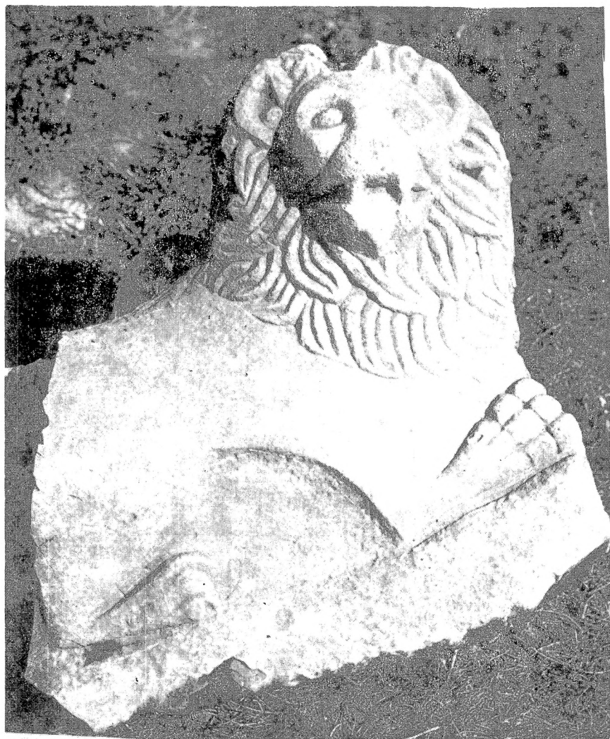
10. Надгробна фигура лава