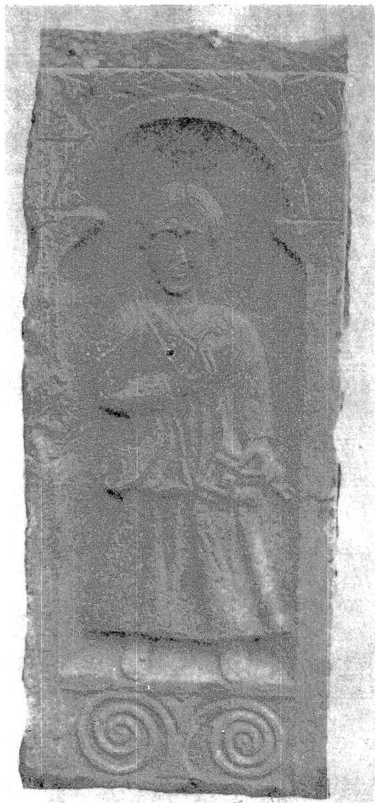
2. Надгробни ципус Паконије Монтане, бочна страна