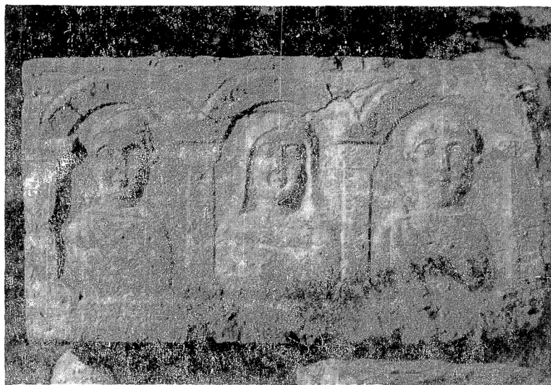
3. Надгробни споменик