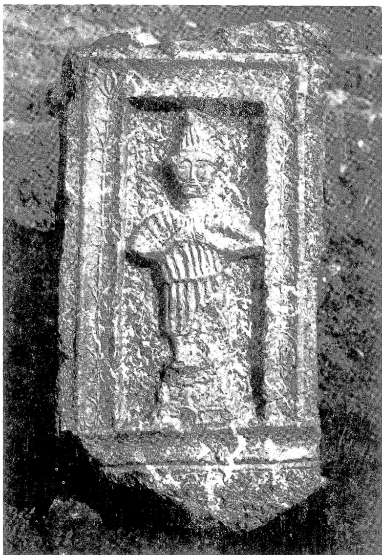
5. Надробна коцка, бочна страна са представом Атиса