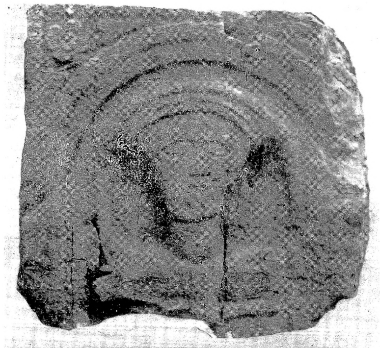
9. Глава покојнице са коцке бр. 8, бочна страна