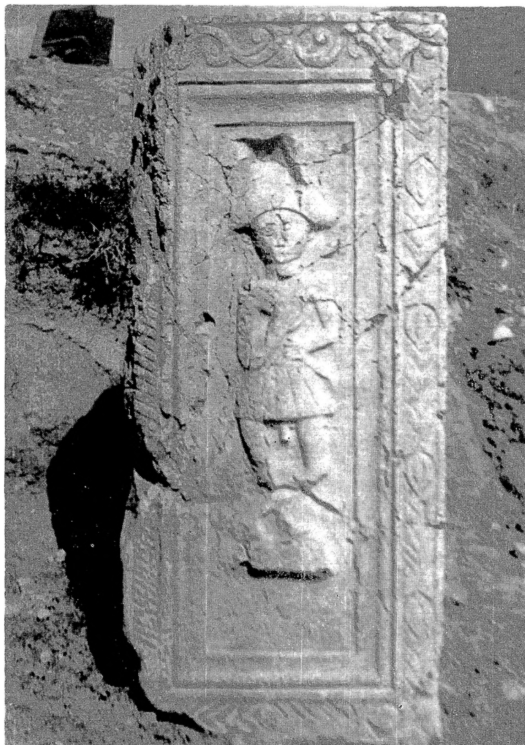
Сл. 1. Надгробни ципус Аурелије Максиме, бочна страна са представом Атиса