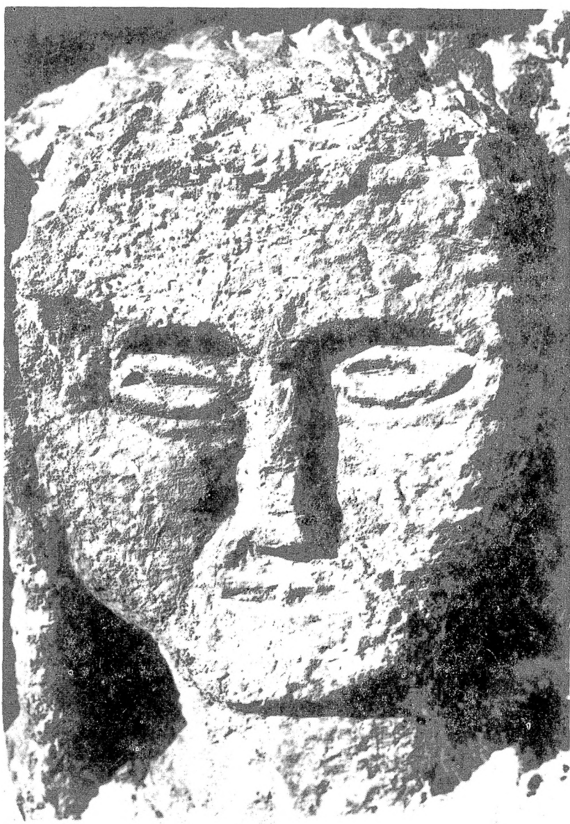
7. Глава покојника са коцке бр. 5.