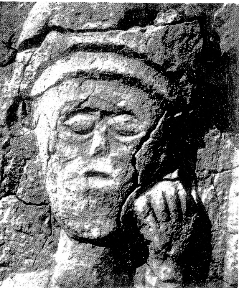
6. Глава Атиса са ципуса Аурелије Максиме