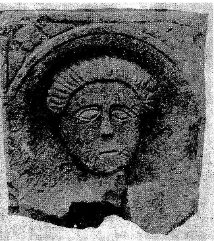
8. Глава покојника са идгробне коцке, бочна страна