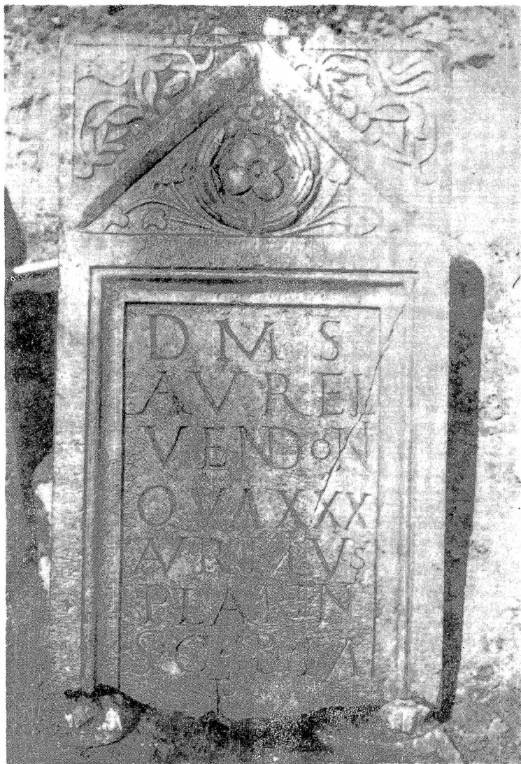
11. Надгробна плоча Аурелија Вендо